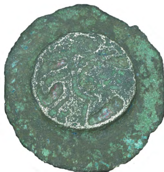
Stanje ohranjenosti okrogle fibule.