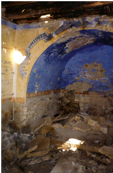
Topolovec, roparski poseg v cerkvi.

Roparski vkop nepravilne ovalne oblike je popolnoma uničil konstrukcijo in vsebino grobnice.