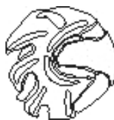
Risba dvignjenega srednjega dela. Risba: N. Grum.