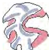
Risba dvignjenega srednjega dela z rekonstrukcijo emajla. Risba: N. Grum.