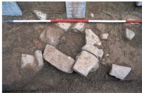
Simonov zaliv. Sezidana stojka v sondi 2