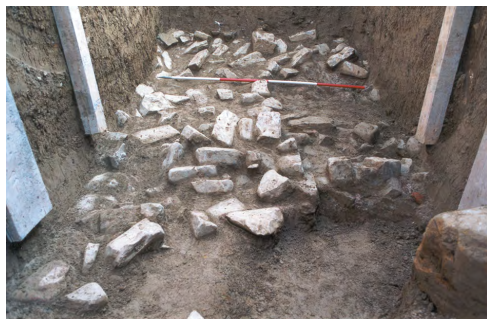
Simonov zaliv. Ruševinska plast v sondi 2

Do preventivnih raziskav je prišlo zaradi predvidene izgradnje fekalnega kolektorja iz smeri Izola pod vzhodno rta Kane po naročilu Občine Izola. Projekt je predvideval do približno 1,5 metra globok poseg. Kulturnovarstveni pogoji Medobčinskega zavoda za varstvo naravne in kulturne dediščine Piran za izdajo gradbenega dovoljenja so naročnika obvezovali, da financira arheološki nadzor na vsej trasi ter tri preventivne arheološke sonde na predelu ogroženosti spo-