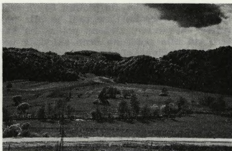
Fig. 87 Sp. Mestinje. View of the probable site

STRANSKA VAS. Dne 4. septembra 1971 je bil Dolenjski muzej obveščen, da so pri hiši Franca Novaka iz Stranske vasi 40 a pri Novem mestu, naleteli pri kopanju temeljev za verando hiše na rimski grob obložen s kamnitimi plo-