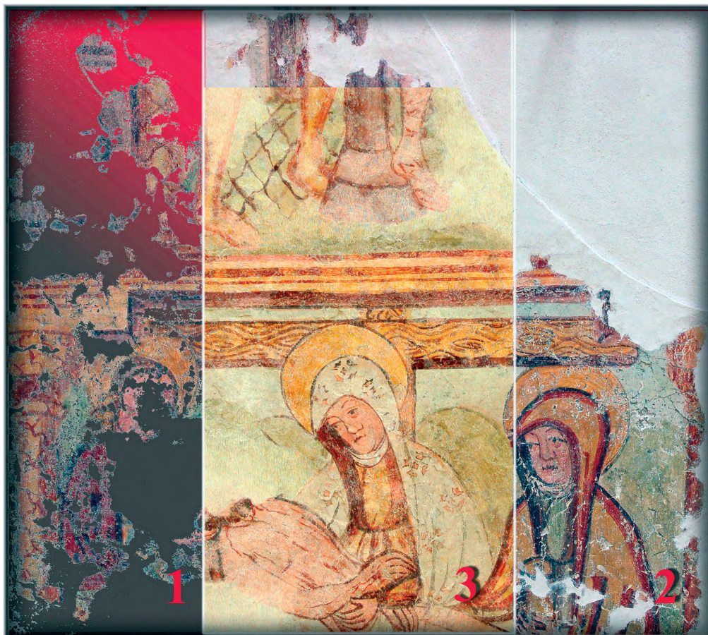
1) Detajl, ostanki originala; 2) Detajl, kitanje na fino in oblikovanje stikov; 3) Detajl, retuširanje s tehniko črtkanja