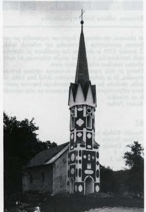
Kronovo, obnova zvonika p. c. sv. Nikolaja

Svojevrstno baročno pojmovanje izraža arhitekturna poslikava zunanjščine. Predstavlja različne geometrijske like – v tonu žgane siene – na osnovni beli podlagi