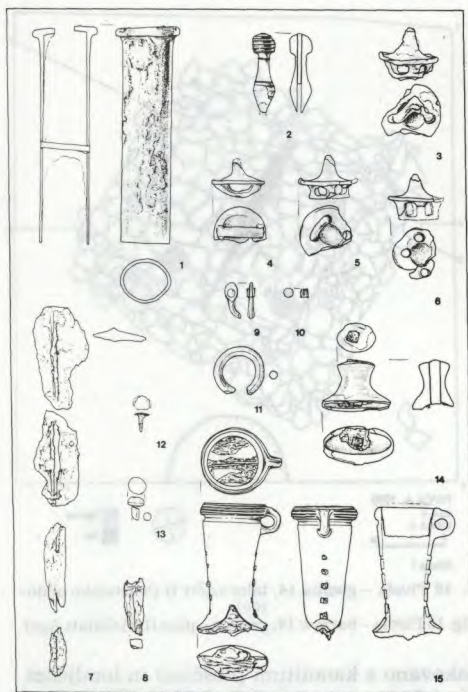
Sl. 18 Pivola – halštatske najdbe iz gomile 14 Fig. 18 Pivola – objects from the Hallstatt Age barrow 14

vedne kovinske pridatke dopolnjuje še keramika: dve bikonični žari, grafitirani in prvotno okrašeni s cinastimi lističi vkomponira-