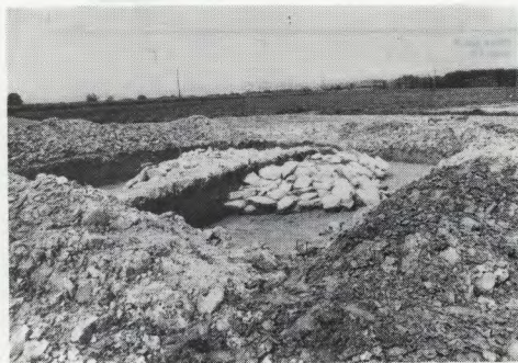
Sl. 19 Pivola – lega halštatske grobnice tik pod površjem tal Fig. 19 Pivola – position of the Hallstatt Age tomb just below the surface of the ground

vedne kovinske pridatke dopolnjuje še keramika: dve bikonični žari, grafitirani in prvotno okrašeni s cinastimi lističi vkomponira-