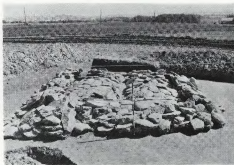
Sl. 20 Pivola – pogled na halštatsko grobnico Fig. 20 Pivola – view of the Hallstatt Age burial chamber

nimi v motivu svastike in stoječih trikotnikov; odlomki žare z izglačeno površino brez grafitnega premaza, okrašena z vtisnjenimi krogi