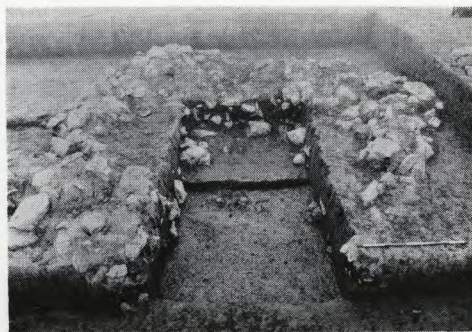
Sl. 14 Novo Mesto, Kapiteljska Njiva, 1989: poizkusno sondiranje v osrednjem grobu gomile I Fig. 14 Novo Mesto, Kapiteljska Njiva field, 1989: informative digging of the central grave of the barrow I