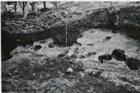
Sl. 3 Gornja Radgona, Voršič – pogled na severozahodni del izkopišča s prazgodovinskimi jamami; naselje iz kulture žarnih grobišč

Hirski ulici 3 na grajskem hribu na parc. št. 448, k. o. Gornja Radgona, lastnika Stanko in Elizabeta Voršič. Najprej smo ročno sneli 20–30 cm debelo humusno plast, pod katero se v južnem in zahodnem delu izkopa pričrjena temno rjava ilovnata prazgodovinska plast s fragmentirano keramiko. V srednjem in