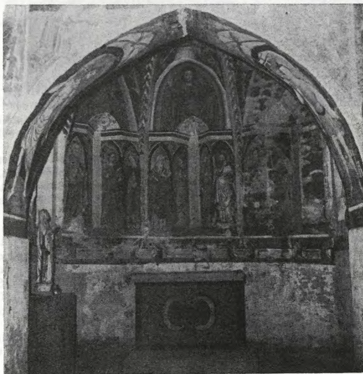
Sl. 74. Visoko pod Kureščkom — freske v prezbitერიju (Benedik 1986) Fig. 74 — Visoko pod Kureščkom — frescoes in the presbitery (Benedik 1986)

Vrzenec, stara plast. Tudi tu imamo opravka z enim samim ometom, ki pa pokriva v celoti zid iz lomljenca, vendar tako, da sledi vdolbinam in izboklinam, torej je le deloma izravnalni omet. Precej grob pesek je dal zelo grobo