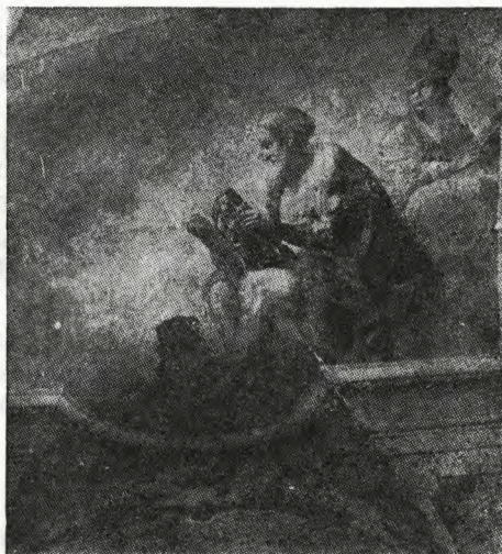
Sl. 77. Ljubljana — Kodeljevo, kapela z Jelovškovimi freskami, detajl

Fig. 76 — Ljubljana — Kodeljevo — the chapel with Jelovšek's frescoes, a detail (Benedik 1986)