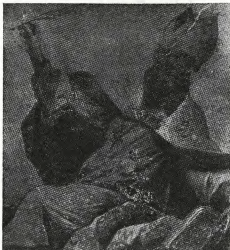
Sl. 76. Ljubljana — Kodeljevo, kapela z Jelovškovimi freskami, detajl (Benedik 1986)

Fig. 76 — Ljubljana — Kodeljevo — the chapel with Jelovšek's frescoes, a detail (Benedik 1986)