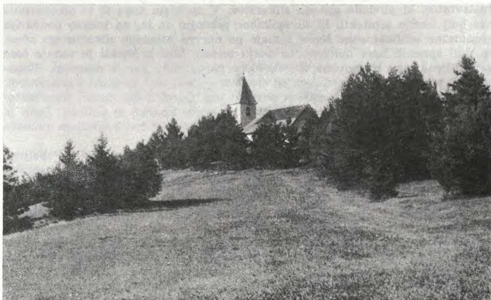
Sl. 72. Srobotnik nad Vel. Laščami — p. c. sv. Roka (Vavken 1974) Fig. 72 — Srobotnik above Velike Lašče — the filial church of St. Rock's (Vavken 1974)

To poglavje ni izčrpen priročnik za restavriranje fresk. Omenjenih je le nekaj primerov, v katerih lahko s pridom uporabimo dobro, staro preizkušeno