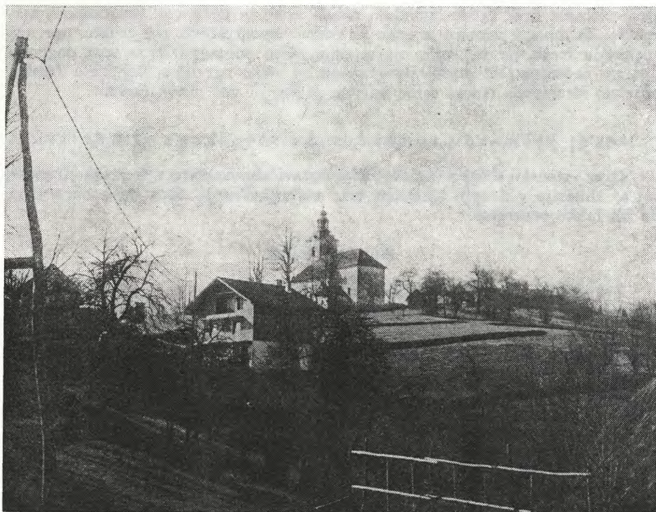
Sl. 73. Velika Slevica — panorama (Vavken 1935) Fig. 73 — Velika Slevica — the panorama (Vavken 1985)

smolami. Če bi jih samo osušili, bi se v mnogih primerih že spremenile v prah. Zato je tak poseg upravičen.