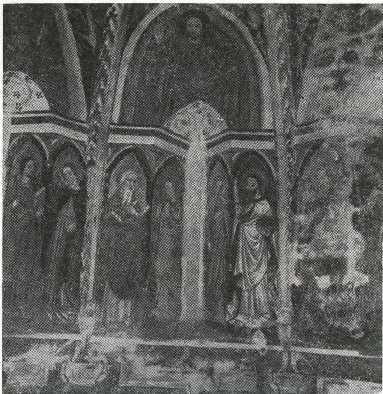
Sl. 75. Visoko pod Kureščkom — freske v prezbitariju, detajl (Benedik 1986) Fig. 75 — Visoko pod Kureščkom — frescoes in the presbiterium — a detail

teksturo, na katero bi bilo težko slikati, zato jo je slikar pred slikanjem nekoliko zgladil z gostim beležem. Sedanje stanje slikarije kaže značaj secca, vendar je to le domneva. Upoštevati moramo, da je slikarija precej visoko nad tlemi; tako so suh zrak in temperaturne razlike v stoletjih prav lahko razrahljali apneno skorjico.