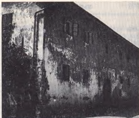
Fig. 13—15 Sentvid near Ljubljana, Guncelj- ska street 37. The façade before and after the restoration; below: a detail with the discovered date of the paintings.

Sl. 13—15 Sentvid pri Ljubljani, Gunceljska 37, hiša pred obnovo in potem; spodaj: de- tajl z odkrito letnico