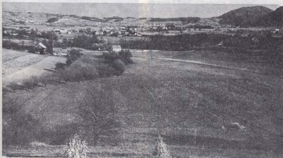
Sl. 31 Hrastje ob Bistrici — pogled na prostor rimskodobne naselbine z zahoda. V ozadju levo je Kumrovec