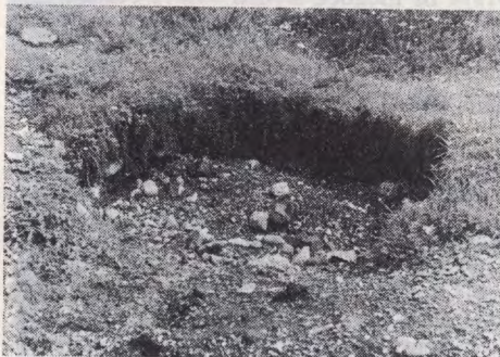
Fig. 28—30 Drnovo. A stone from a Roman architecture, used as hearth; on the right the overturned, already presented Roman epigraphic stone; right: traces of wild digging in the area of the centre of the Roman Neviodunum