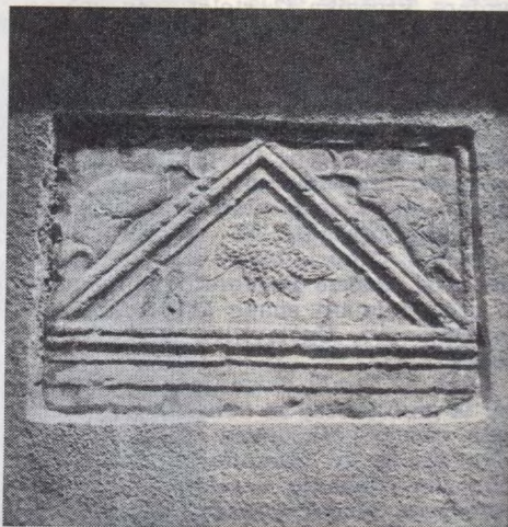
Sl. 27 Dolenje Lakovnice — vrhnji del antičnega nagrobnika

DOLENJE LAKOVNICE, IX, 5, Novo mesto. — Ob arheološkem topografiranju jv. Dolenjske smo 18. 4. 1978 ponovno našli vrhnji del rimskega nagrobnika z orlom v zatrepu in delfinoma v zaklinih (sl. 27). — Prvič je bil najden leta 1876, ko so Zupancičevi iz Dol. Lakovnic št. 2 na njivi Na sobešni , parc. št. 602, k. o. Lakovnice, nabirali kamenje za zidavo hiše. Istega leta so spomenik vzdali d. od glavnih vrat, gledano iz hiše, kjer je še vedno. — O najdbi sta poročala Leinmüller. MZK 15, 1889, 211, in Rutar. LMS 1890, 122. V nagrobnik je vklesana letnica 1876 kot spomin na zidavo hiše, prav to pa je preprečilo, da ga niso že zdavnaj odpeljali v muzej. Dolenjski muzej poskuša v sodelovanju z LR ZSV spomenik pridobiti za svojo zbirko. — D. B.