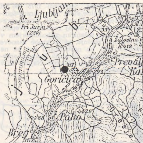
Sl. 31 Goričica pod Krimom, kraj najdbe deblaka

Fig. 31 Goričica pod Krimom, the finding place of a dug-out canoe