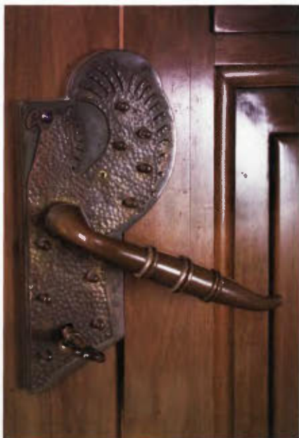
Zakristija, detajl kljuka na vratih.

..... treba omeniti lesena vrata v zakristijo. Zgornje vratno polnilo je zapolnjeno z leseno plastiko v obliki amfore. Kovinska kljuka na vratih je oblikovana kot petelin z razprtimi perutmi. Luč na stropu zakristije se odpira kot zvezda na nebu. V zahodnem kotu zakristije so nameščene lesene menjalne stopnice, ki omogočajo bolj strm naklon stopnic.