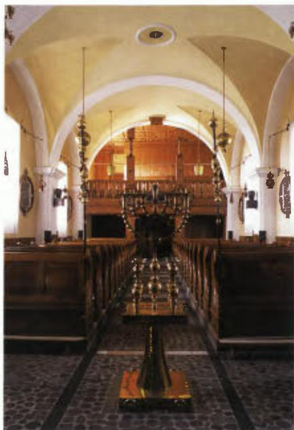
Pogled na pevski kor.