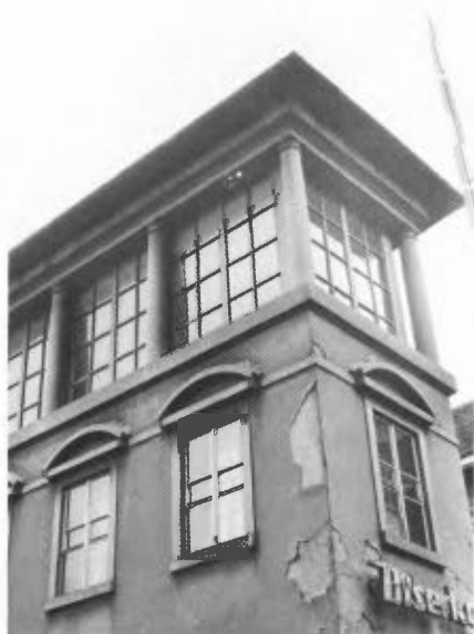
Stanje pred obnovo fasade leta 1990.

..... Določeni sta bili struktura in barva grobega in finega ometa za potrebno rekonstrukcijo tistih delov ometa, ki jih zaradi poškodb ni bilo mogoče ohraniti. To je bilo v tem primeru za doseg končnega enotnega videza izjemno pomembno, saj prvotno fasada ni bila pleškana. Na podlagi poskusnih vzorčnih polj za čiščenje elementov, izdelanih iz teraca 1 v brušeni tehniki s peskanjem, je bil določen način, ki ni poškodoval glazure teraca. Balkonske ograje, zaščitne kovane mreže na oknih, stavbno pohištvo, streha in nadstrešek so bili v sklopu obnove fasade očiščeni in obnovljeni.