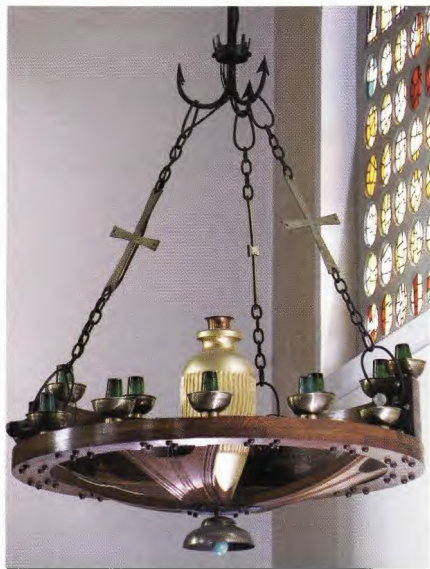
Lestenev v cerkvi sv. Cirila in Metoda.