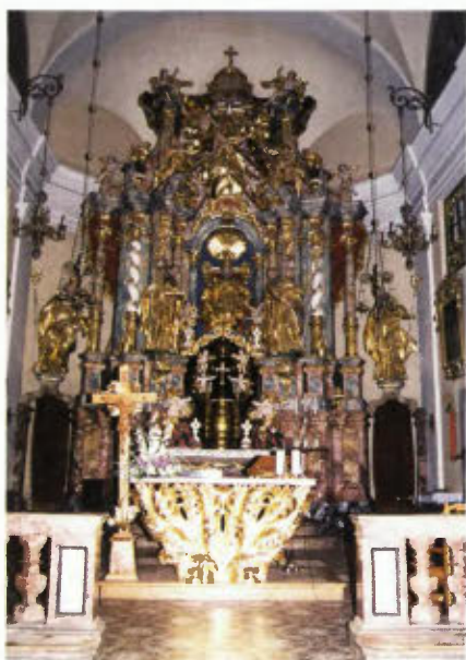
Glavni oltar s Plečnikovim tabernakljem.