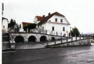
Obstoječa dostopna klančina.

da je nanj obesil velik litoželezni zvon; tega je dojemal kot simbol vojne in smrti, saj so med prvo svetovno vojno mnogo bronastih zvonov pretopili in jih nadomestili z litoželeznimi. Ta spomenik je nameraval Plečnik postaviti med dostopno klančino in stopnišče, kakor je razvidno z načrta. Danes stoji spomenik pred vhodom na pokopališče.