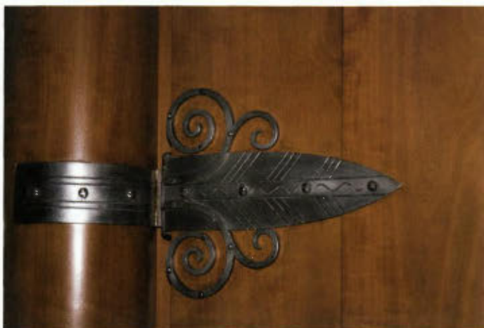
Detajl izvedene knjižne omare. .....

Priznanje statusa kulturnega spomenika lovski koči kralja Aleksandra in pripadajoči okolici je odvisno od odločitve občinskih svetnikov Občine Kamnik. Upajmo, da bodo znali oceniti prednosti, ki jih prinaša ohranjanje dragocenih značilnosti ambienta Kamniške Bistrice, znotraj katerega je svoj občutek za poseganje v naravo izkazal tudi arhitekt Jože Plečnik.