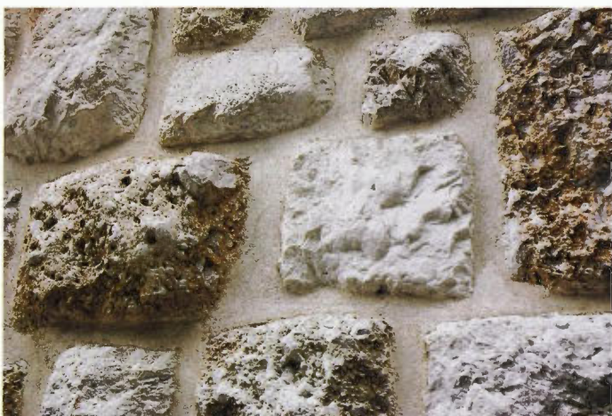
Detajl kamnite fasade.

Po drugi svetovni vojni je bila lovska kočica nacionalizirana. Nova jugoslovanska oblast jo je uporabljala kot protokolarni objekt. Upravljal ga je Zavod za gojitev divjadi Kozorog. Sem so zahajali na lov in oddih ljudje iz političnega vrha. Koča je pogosto uporabljal tudi predsednik Jugoslavije Tito, zato je znana tudi pod imenom Titov dvorec. Kozorog je v koči organiziral tudi lovski turizem za bogate tujce.