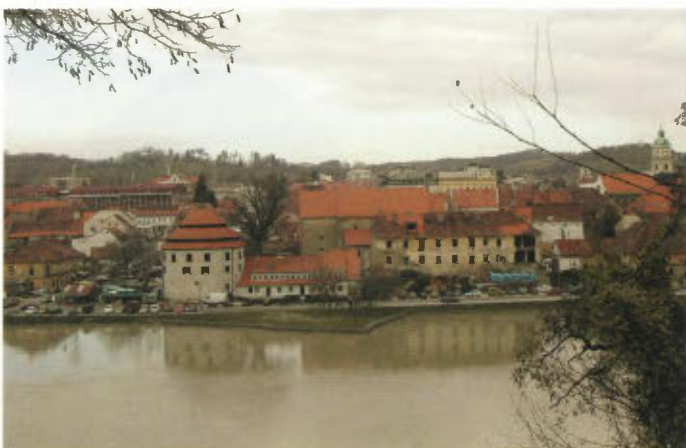
Obnovljeni Sodni stolp, na utrdbo Benetke spominja obrečni pomol.

Požavka so dvignili 1500-tonskega kamnitega orjaka pentagonalnega tlorisa. Proces dvigovanja je trajal celih sedem mesecev v letih 1967 in 1968.