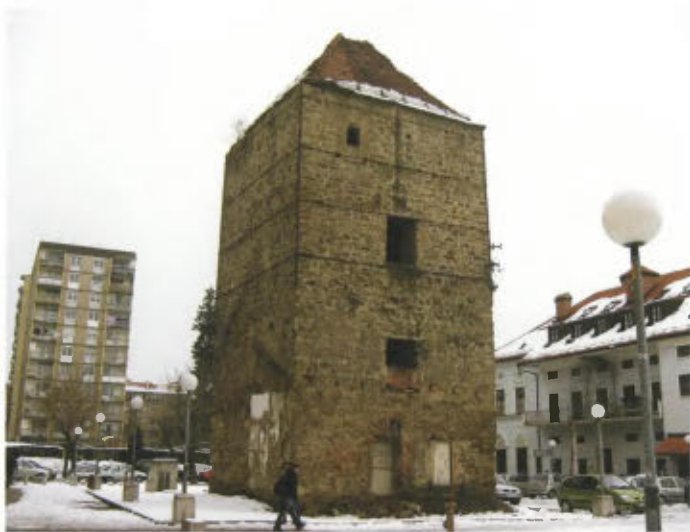
Srednjeveški Čeligijski stolp danes.

..... največja kvaliteta je v ohranjenosti utrdbene arhitekture, ki je obdržala svojo funkcionalno in likovno podobo od nastanka do danes.