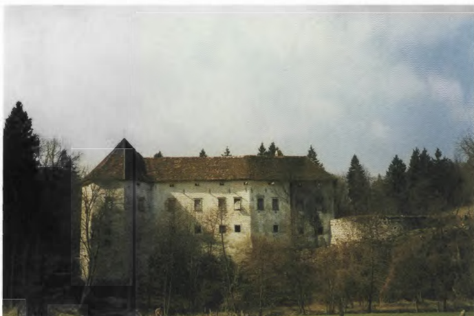
Pogled na vzhodno fasado pred obnovo.

Grad Jablje je postavljen na skrbno izbrani lokaciji, nad izvirom potoka na robu skalnatega pobočja. Pozidan naj bi bil leta 1530, v pisnih virih pa se prvič omenja že leta 1268. Ima srednjeveško zasnovo, sedanja arhitektura pa ohranja renesančni karakter. Zadnje večje predelave je grad doživel po potresu leta 1895. V svojih temeljnih potezah je to štiriraktna, delno podkletena, enonadstropna stavba s podstrešno poletažo. Stanovanjski trakti obdajajo notranje pravokotno arkadno dvorišče. Na južni strani se k zasnovi prislanjata poligonalna stolpa, manjši jugozahodni in večji jugovzhodni. Grad je imel prvotno vogalni stolp še na severozahodnem vogalu, vendar so ga podrli v času pozidave novega severnega trakta. V osi južne fasade je preprost renesančni portal, nad katerim je bil nekoč grb Lambergov,