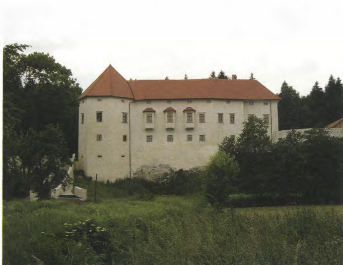
Pogled na vzhodno fasado po obnovi.