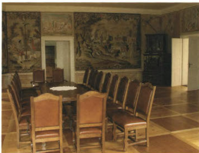
Slavnostna jedilnica z Jelovškovimi poslikavami in slikanimi tapetami.

Prva faza del, obnova gradu in ožje okolice, je bila končana s pridobitvijo uporabnega dovoljenja v maju 2004. Zaradi sprememb