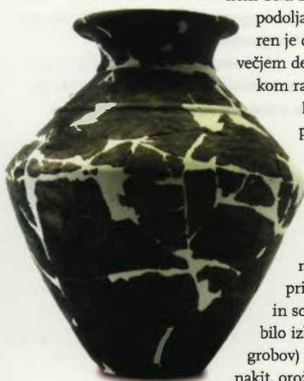
keramična žara iz latenskega groba

Rimskodobna naselbina s pripadajočim manjšim grobiščem leži v donedavno poplavnem nižinskem delu