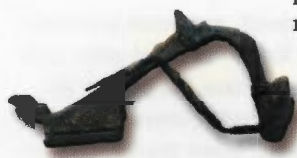
bronasta rimska sponka

in je delno prekrivala latensko grobišče. Štirje objekti imajo kamnite temelje iz prodnikov in lomljencev, narejeni so v suhozidni tehniki – brez ohranjenega veziva – in trije so dokaj velikih dimenzij (okrog 20 x 15 m). Arhitekturnih elementov, ki bi nakazovali videz nadzemne konstrukcije, nismo našli. V najbolje ohranjenem smo raziskali objekt kvadratnega tlorisa s prizidkom, ki je prebil obodni zid. Domnevamo, da obodni zidovi niso presegli parapetne višine in so služili kot ograde z gospodarsko vlogo. Eden od objektov je bil manjših dimenzij (pribl. 11 x 11 m) in delno poškodovan z recentnim vkopom. V notranjosti smo odkopali štiri jame, napolnjene s kamenjem in malto. Žal namembnosti objekta ne moremo prepričljivo določiti. V objektih je bilo odkritih zelo malo drobnih najdb, po dveh fibulah in novcu pa jih datiramo v čas med poznim 1. in zgodnjim 3. stoletjem n. š.