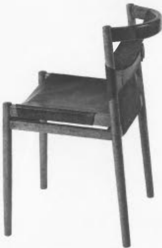
Stol izdelan po načrtih arhitekta Janeza Lajovica za hotel Prisank je bil leta 1964 na prvem Bienalu industrijskega oblikovanja v Ljubljani nagrajen z zlato medaljo.

V samem objektu je treba v sodelovanju z avtorjem arhitekture