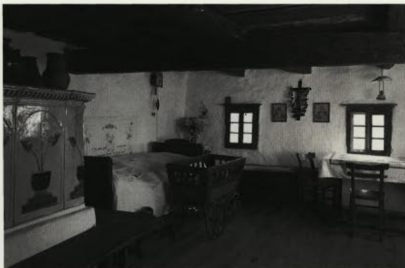
Bivalni prostor ... »V »hiši«, ki ima lepo izdelan, preprost lesen tramovni strop, je krušna peč z barvitim cvetličnim vzorcem, staro pohištvo: omara, predalnik, postelja« ...

Po obnovi smo vse prostore v bivalnem in gospodarskem delu stavbe spet opremili z ohranjeno staro opremo in pohiš-tvom, ki izvirata iz različnih obdobij. V obokani črni kuhinji je ognjišče z vsemi potrebnimi pripravami in starim posodjem. Pred ognjiščem je hrastova polica »komen«, na kateri stojijo železne in lončene posode, v kotu stoji »stolica« za vodo, na