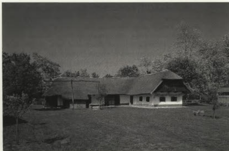
Obnovljena Dominkova domačija ... »Nekoliko vstran od glavne ceste, kakor da bi se hotela umakniti prometnemu vrvežu, stoji Dominkova hiša« ...

Dom je oblikovan vogalno. Bivalnemu delu stavbe sledijo gospodarski prostori v obliki črke L. Stavba je lesena, grajena v kladni konstrukciji z enostavno oblikovanimi strešnimi konzolami. Ometana je z ilovnatim ometom in pobeljena z apnom. Talni zidec »pojas« je temno siv. Streha, čopasta dvokapnica, je pokrita s slamo. Pod širokim strešnim napuščem je pohodni